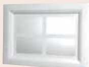
Visio 4 496 x 330 mm