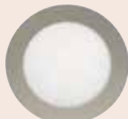
Rond 280 mm