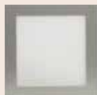
Carré 264 x 264 mm