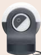
Boîtier de commande murale