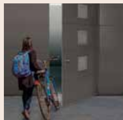
Porte de garage sectionnelle avec portillon.