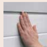
Panneaux anti pince-doigts