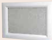
Visio glass delta mat 496 x 330 mm