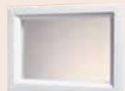
Visiomax 496 x 330 mm