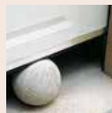
Arrêt sur obstacle