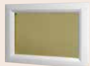
Visio glass antique jaune 496 x 330 mm