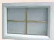
Visio glass déco laiton 496 x 330 mm