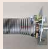
Pare-chute sur ressort