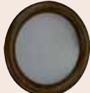
Visiorond plaxé 315 mm