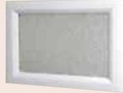
Visio glass 496 x 330 mm