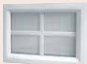
Visio glass déco blanc 496 x 330 mm