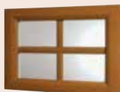
Visio glass petit bois plaxés 496 x 330 mm