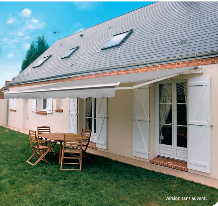
Version sans auvent.